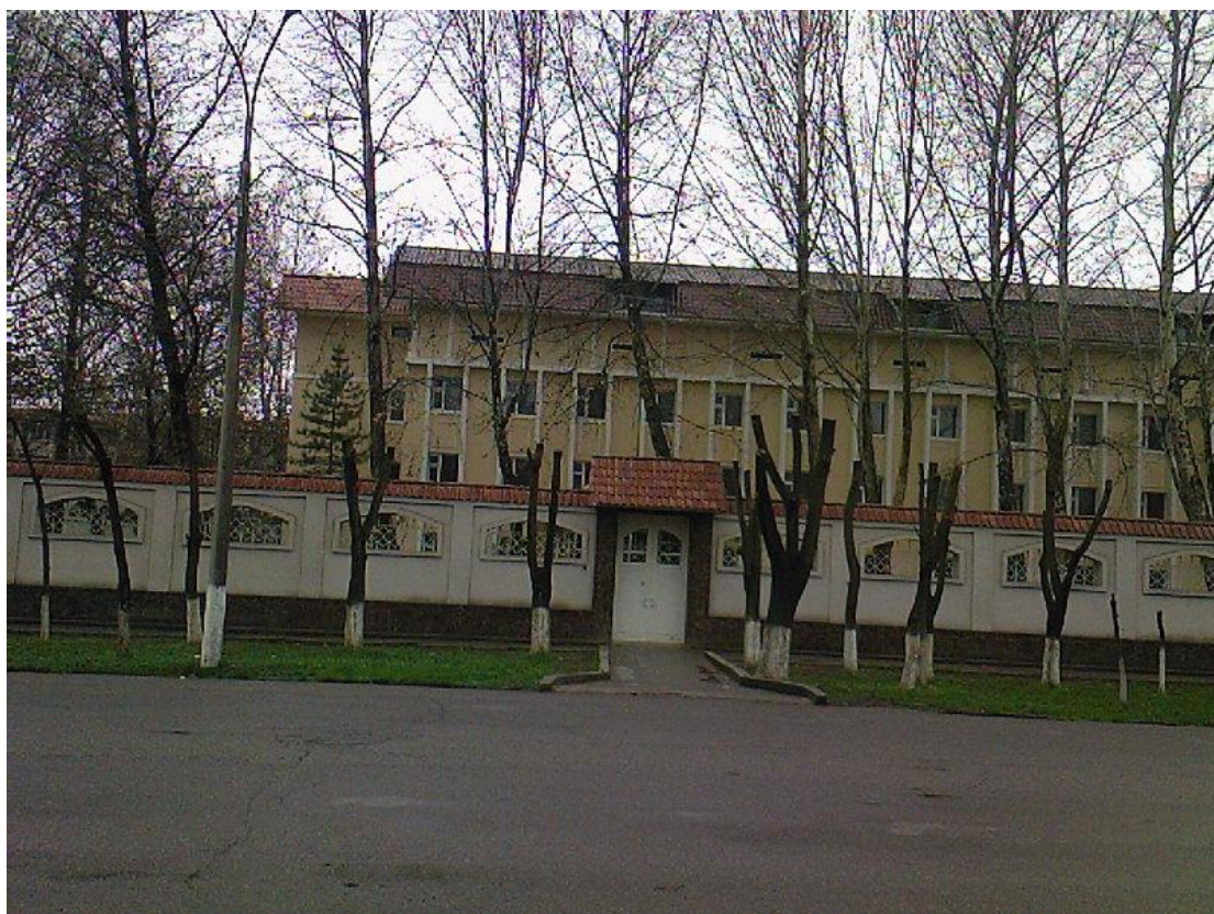
מבנה המרכז החדש – מראה מכביש הגישה

בעתיד הרחוק יותר בכוונת היזמים להקים מרכזים רפואיים הדומים למרכז המוקם בxxx, גם בערים המבוססות האחרות בxxx. כמו כן, בכוונת היזמים לשווק פוליסות ביטוח בריאות (תחום שאין אליו מודעות באוזבקיסטן) ובנושא זה קיימת אצל היזמים כוונה להקים חברת ביטוח במדינה.